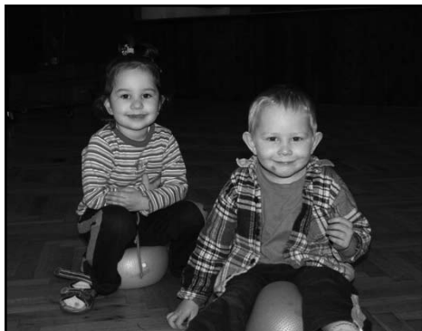
Klub maminek s dětmi – Benešov