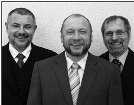
Úzká rada Jednoty bratrské