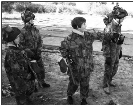
K-klub – Králíky

lektory a Florbal pro mladé. Uskutečnili jsme několik mimořádných aktivit a zúčastnili jsme se jednoho mládežnického festivalu.