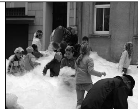
The Bouda – Turnov

Ve spolupráci s Novou nadějí o.s. jsme v rámci programu primární prevence sociálně-patologických jevů uspořádali 26 přednášek (dvě základní a tři střední školy) na téma AIDS/HIV, drogy a závislost, sex a sexualita, partnerské vztahy.