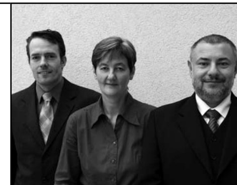
Výkonná rada Jednoty bratrské

Pro zvýšení profesní úrovně práce vytvořila Úzká rada v tomto roce nový vzdělávací projekt pro zaměstnance církve i dobrovolníky.