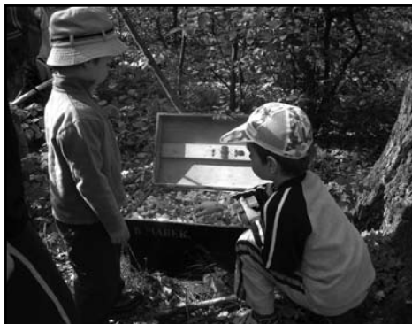
Rodinné centrum Beránek Choceň

teřská škola i DDM, který nabízí širokou škálu kroužků a volnočasových aktivit, florbalový klub Hradečtí lvi - FBC Sion patří k nejúspěšnějším celkům Krajské ligy elévů. V roce 2008 jsme získali od města Hradec Králové budovu bývalé městské školky.