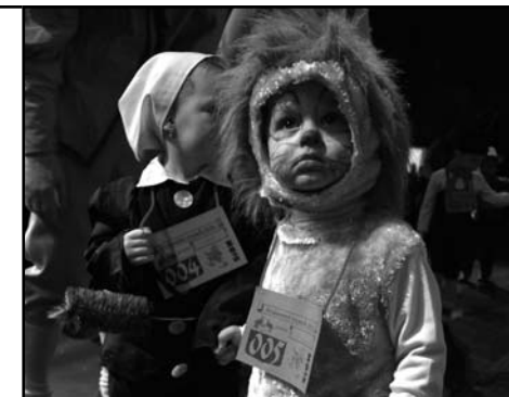
Hradec Králové – Dětem pro radost