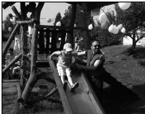
Rodinné centrum Srdíčko Ústí nad Orlicí