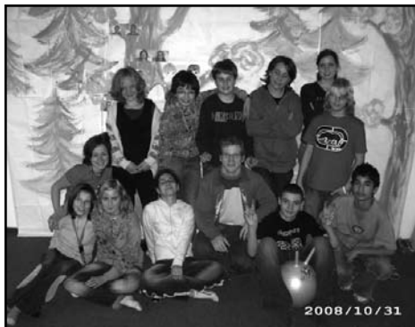
Děčko – Mladá Boleslav

ky. Sbor ve spolupráci se svými organizacemi pořádal i větší akce. Mládež se v dubnu spolu s dalšími účastnila projektu NATO Service Projekt (USA). V Turnově stavěla dětská či školní hřiště. V květnu 2008 byl sbor spolupořadatelem festivalu mládeže J-fest, v srpnu English Campu v Krkonoších a v prosinci spoluorganizátorem koncertu americké rockové kapely Day of Fire.