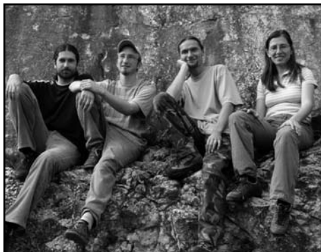
Hudební skupinka – Ostrava