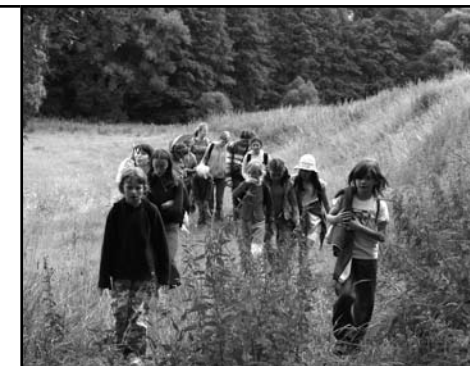
Tábor Jeseníky – Praha

Sbor Jednoty bratrské v Ostravě rozvíjel v roce 2008 svoji činnost pro veřejnost v několika směrech. Především se jednalo o klubové večery s různou tematikou (cestopisné besedy, přednáška o partnerských vztazích), jejichž cílem bylo nabídnout široké veřejnosti hodnotné využití volného času v přátelské a neformální atmosféře. V roce 2008 se poprvé uskutečnilo tvořivé odpoledne, setkání ve formě výtvarného a rukodělného workshopu určené zejména pro ženy.