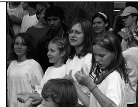
Tábor Letařovice – Nová Paka

Akce pro širokou veřejnost – Naší největší akcí v r. 2008 byla putovní výstava při příležitosti 550 let vzniku Jednoty bratrské. Slavnostní vernisáže za přítomnosti ministra