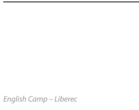
English Camp – Liberec

Na jaře jsme zahájili pravidelná setkávání volnočasového klubu. V červenci jsme se podíleli na pořádání tábora s výukou angličtiny English camp. Na počátku září jsme zorganizovali Týden proti drogám, kde lektori z o.p.s. Maják přednáškami oslovili 420 žáků a studentů místních ZŠ a SŠ. Na Týden proti drogám volně navázal víkendový