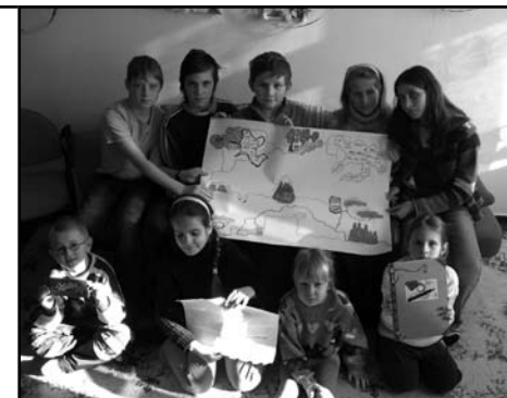
Klubík – Dobruška

Pro mladší a střední generaci pořádáme společné výlety v okolí České Lípy. Sjezd Ploučnice na konci června se pro účastníky stal nezapomenutelným dobrodružstvím. Tato generace si oblíbila klub zvaný Cestománie, kde se uskutečnila řada setkání se zajímavými hosty, kteří procestovali různé země několika kontinentů. Alpy na kole, okružní cesta Austrálií, Jižní Amerika, expedice do Himalájí, Sibiř a další zajímavá místa naší planety.