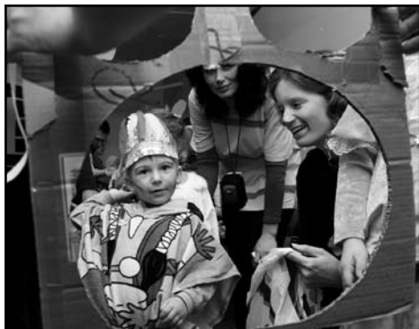
Mamik – Frýdlant