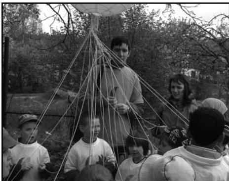
5KA – Rychnov nad Kněžnou

vztahů. Pravidelně pracujeme s dětmi různých věkových skupin a pořádáme tematická setkávání skupin svobodných mužů, žen i rodin.