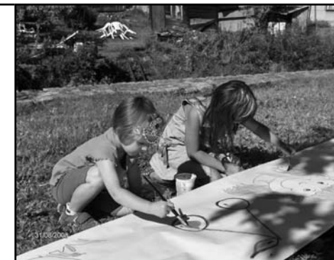
Centrum dobrého času Bétel Chrastava